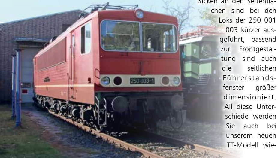
Abb. 2: BR 250 Vorserie (M. Heßler, bearbeitet).

Mit der Workshop-Lok erscheint die Neukonstruktion einer DR-Elektrolokomotive.